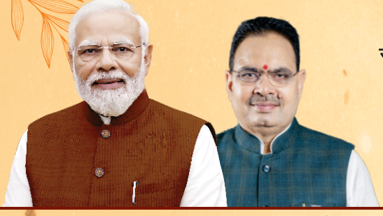
श्री नरेन्द्र मोदी माननीय प्रधानमंत्री